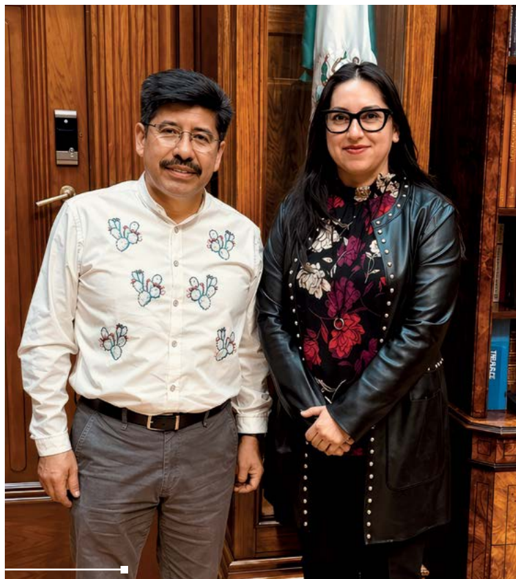
Urenda Navarro con el presidente de la SCJN, Hugo Aguilar.